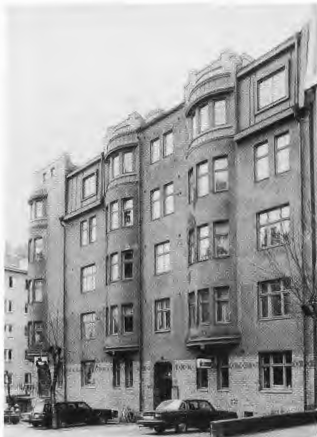
Kv Ryttaren 8

Även trapphusen har vanligen en genomtänkt estetisk utformning som i många fall är välbevarad än idag. Väggarna är, liksom spegeldörrar och lister, marmorerade