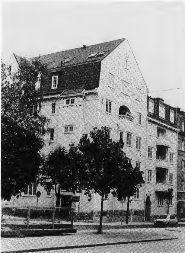
Kv Lönnen 4 har nyligen renoverats pietetsfullt.

Den nya förstaden var ämnad för bättre situerade människor, som skulle ges möjlighet att "föreina stadens bekvämligheter med lantlivets behag". Samhällets kärna skulle få stadskaraktär med större flerfamiljshus runt gemensamma gårdar, och stadskärnan skulle omges av en yttre ring villabebyggelse.